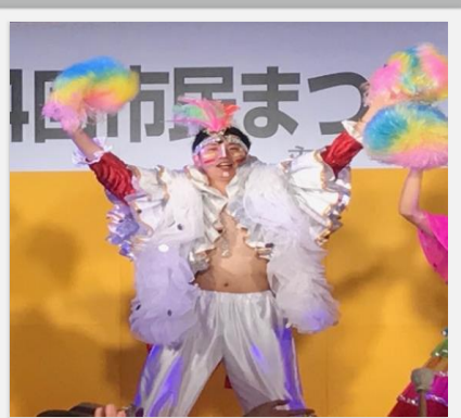
習志野きらっと祭りにて