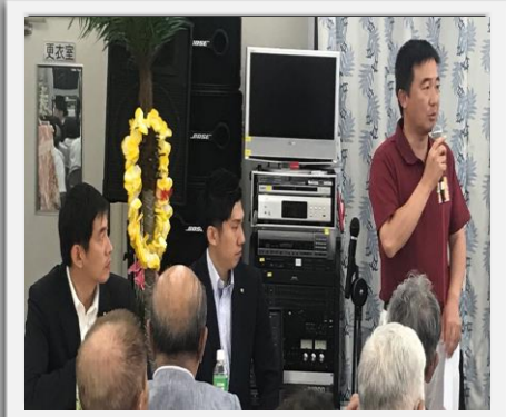
地域での市政報告会