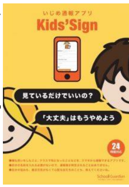
川越市で導入されているアプリ [Kids' Sign]

学校で定期的に行われる従来の紙アンケートでは、いじめの情報をリアルタイムにキャッチアップできない。この問題点を解消するために「いじめ匿名通報システム」では契約している学校へ個別のURLを配布。生徒たちはいじめを発見した際に、情報をいつでもどこでも匿名で書き込むことができます。通報は管理企業のスタッフが常にチェックし、早急に対処すべき案件などを学校側へ報告。構築から運用までを企業側がサポートすることで、学校側のいじめの早期発見につなげる仕組みです。